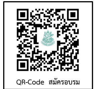
QR-Code สมัครอบรม

ชื่อบัญชี : มหาวิทยาลัยศิลปากร เลขที่บัญชี : ๙๘๒-๓-๐๔๗๘๑-๒