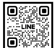
QR-Code ใบสมัคร QR-Code เพื่อสอบถามข้อมูล